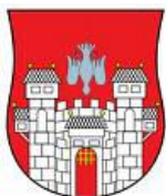
Mestna občina Maribor