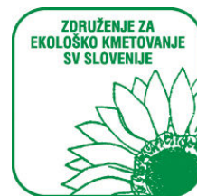
Zdrúženje za ekološko kmetovanje SVS