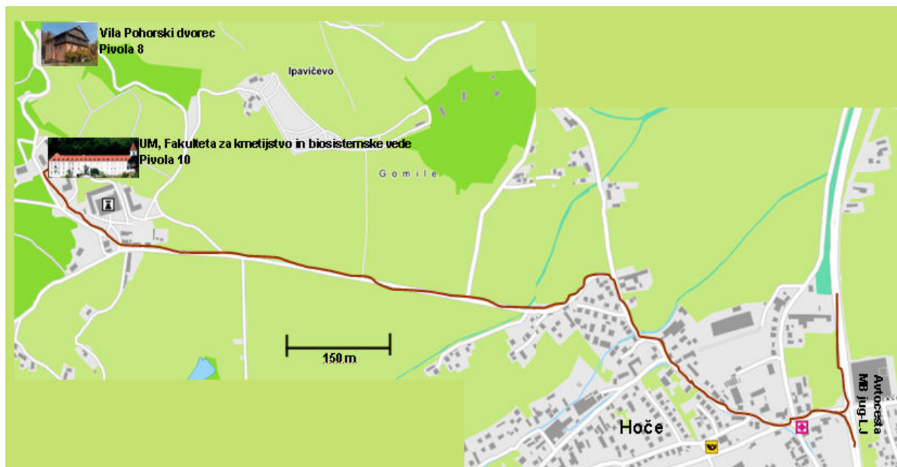
Grad Hompoš, Pivola 10