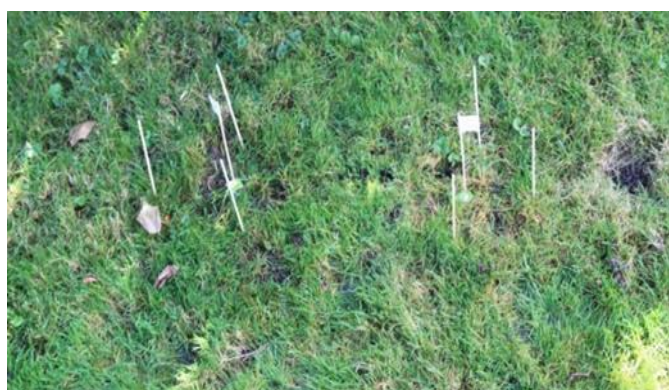
Mesta na vrtu, kjer smo zakopali čajne vrečke, zaznamujemo s palicami.