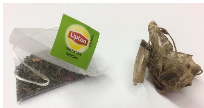
Čajni vrečki, original in po izkopu.