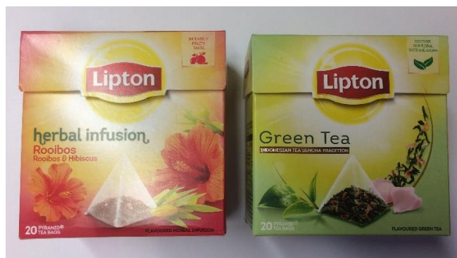
Čajne vrečke znamke Lipton.

*V spletni trgovini nizozemskega supermarketa boste pri nakupu deležni 10% popusta, če na strani za plačilo v ustrezno polje vnesete kodo "tbi".