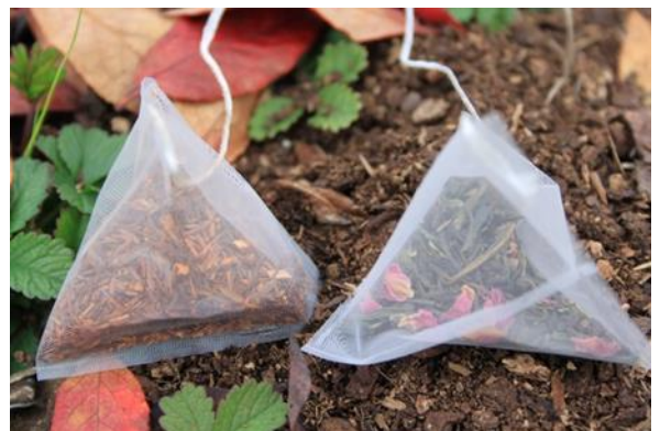
Čajne vrečke (rooibosa in zelenega čaja) iz najlonske mrežice.

S pomočjo dveh različnih tipov čaja lahko primerjamo stopnje razgradnje in stabilizacijske dejavnike razgradnje med različnimi polji in različnimi tlemi. Omenjeni pristop je del globalne raziskave geoklimatskih vplivov na razgradnjo.