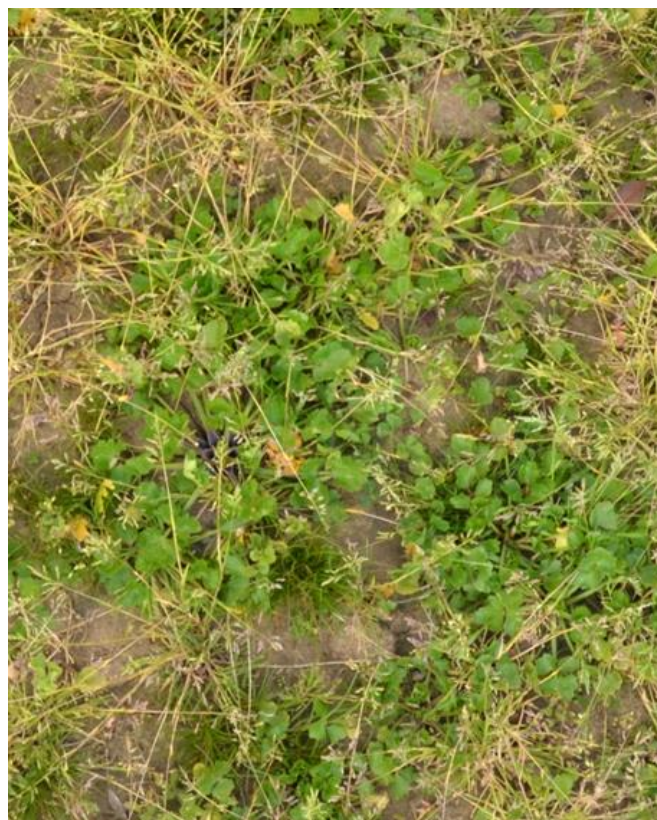
Vlažna tla z velikim deležem Poa annua in Ranunculus repens .

2. Z ene strani se v cikcaku premikajte proti sredini njive. Zabeležite glavne plevelne vrste in pri vsaki na oko ocenite, kolikšen delež tal pokriva. Na listu za vzorčenje zabeležite glavne vrste, ki ste jih našli na prvem vzorčnem podobmočju (npr. "A"). Postopek ponovite na drugem (npr. "B") in na vsakem nadaljnjem podobmočju vzorčenja.